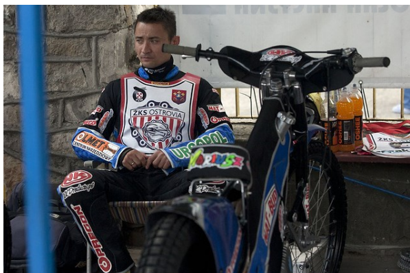
Autor: Wojciech Szubartowski