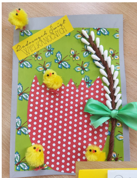
III miejsce—Wojciech Kopa