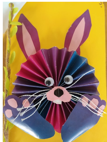
III miejsce—Igor Usarek